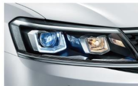
锐光氙气大灯带LED日间行车灯