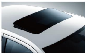
双层防夹电动天窗