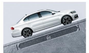
HHC坡道起步辅助系统