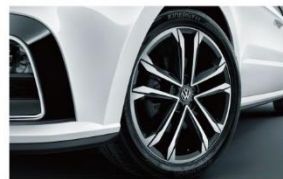
17吋运动铝合金轮毂