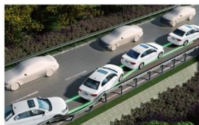
MKB多次碰撞预防系统