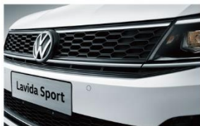
蜂窝状进气前格栅